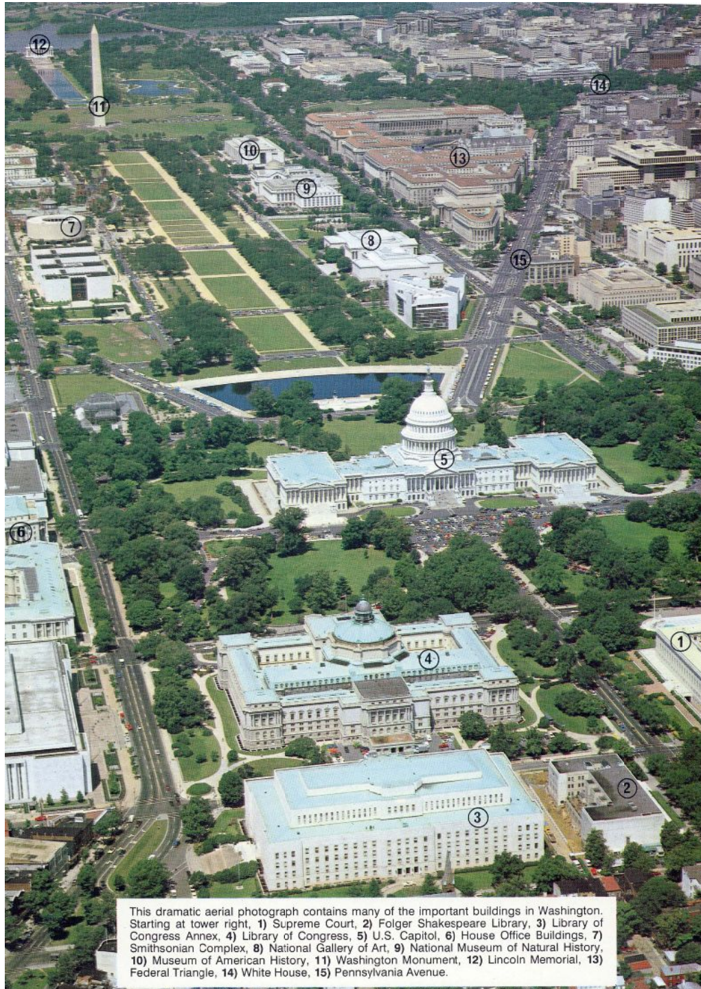
This dramatic aerial photograph contains many of the important buildings in Washington. Starting at lower right, 1) Supreme Court, 2) Folger Shakespeare Library, 3) Library of Congress Annex, 4) Library of Congress, 5) U.S. Capitol, 6) House Office Buildings, 7) Smithsonian Complex, 8) National Gallery of Art, 9) National Museum of Natural History, 10) Museum of American History, 11) Washington Monument, 12) Lincoln Memorial, 13) Federal Triangle, 14) White House, 15) Pennsylvania Avenue.