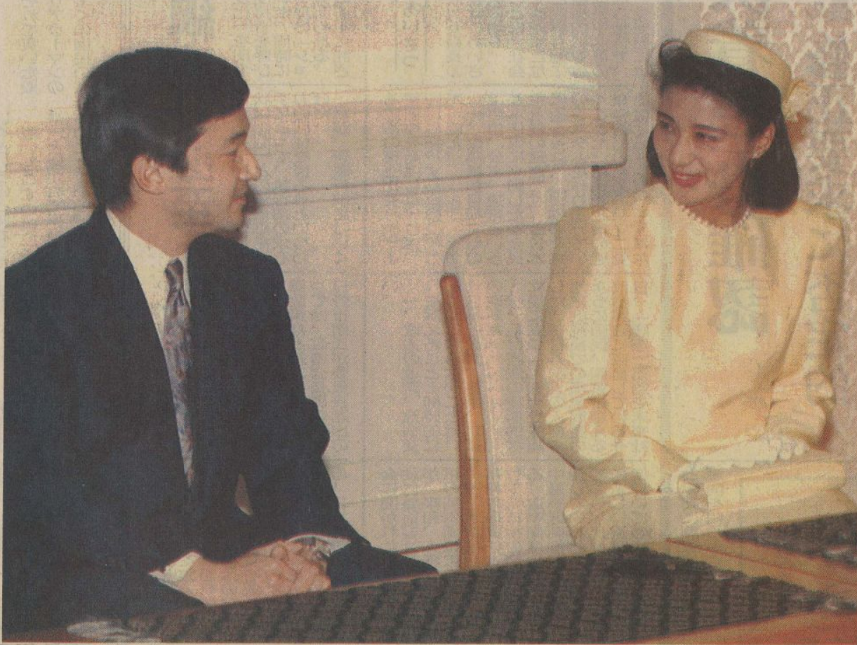
婚約決定後の記者会見で、プロポーズの時期についての質問に顔を合わされる皇太子さまと小和田雅子さん。19日午後2時48分、東京・元赤坂の東宮仮御所で